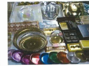
成型用ラミネート蒸着シート